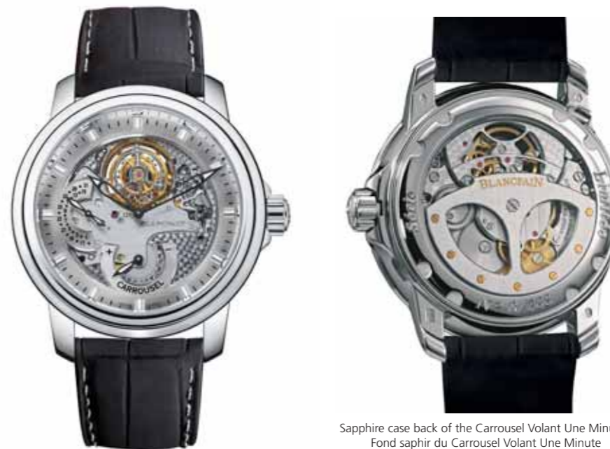
Sapphire case back of the Carrousel Volant Une Minute / Fond saphir du Carrousel Volant Une Minute